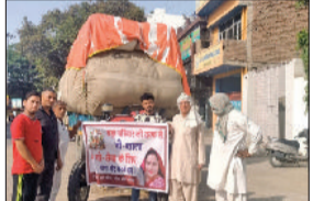
मिवाणी। गोशाला में चारा भेंट करते हुए।

लोहारू। लोहारू शहर स्थित एक ई.लाइब्रेरी में पढ़ने वाली एक छात्रा बीते दिवस लाइब्रेरी के बाद घर नहीं पहुंची। जिसकी युवती के पिता ने लोहारू पुलिस थाने में गुमशुदगी की शिकायत दर्ज कराई है। पुलिस को दी शिकायत में युवती के पिता ने बताया कि उसकी बेटी लोहारू के एक लाइब्रेरी में पढ़ने जाती थी। लेकिन बीते दिवस सांघ को वह घर नहीं लौटी। बेटी की आस पड़ोस में भी काफी तलाश की गई लेकिन वह नहीं मिली।