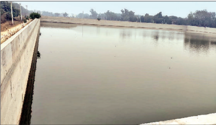
भिवानी। पानी की कमी के चलते जलघरों में जमा आधा पानी और पानी कम पहुंचने की वजह से नहरों में बहता आधा पानी।

जुई, सुंदर के पानी में कटौती कर मिताथल फीडर में छोड़ गया पानी