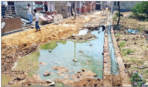
बवानीखेड़ा। गांव मिलकपुर में बन रह मार्ग का दृश्य।