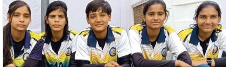
बहल। भारत की डॉजबॉल टीम में चयनित श्रीराम इंटरनेशनल स्कूल के खिलाड़ी।